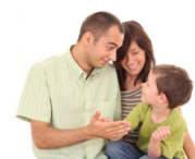
Familien stärken – Kinder unterstützen

www.psychologie.uzh.ch/fachrichtungen/kjpsych/tagung/fam.html